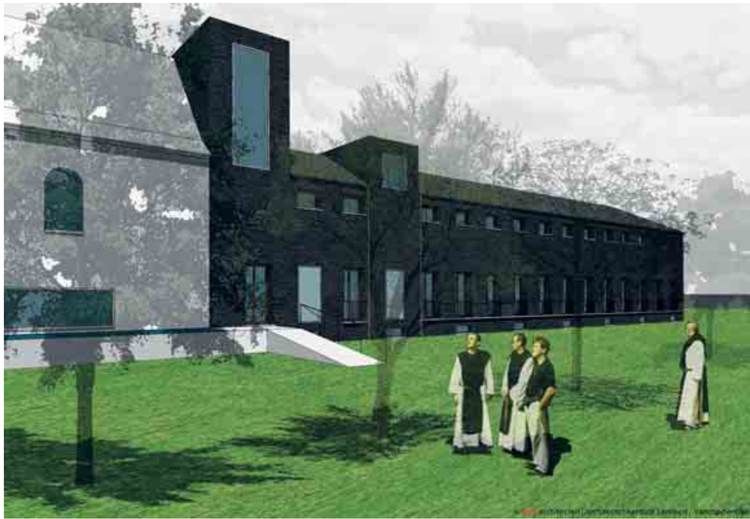
Westvleteren krijgt tegen 2010 een gedeeltelijk nieuwe abdij.

Het was nodig om de kloostergebouwen bij de tijd te brengen, vond de abt Manu Van Hecke. In de plaats van de huidige slaapzaal krijgen de monniken individuele kamers. Verbouwen was geen optie. De scheuren en verzakkingen in het hoofdgebouw vroegen om een drastischer oplossing. Bodemonderzoek had aangetoond dat de fundering niet dieper reikt dan de bovenste slappe kleilaag. In een ontkerkelijkt tijd is het voor een kloostergemeenschap moedig om te investeren in een grootschalig nieuw bouwproject. 'Het is een waagstuk', zegt broeder Manu. 'Maar ook een zaak van geloven en vertrouwen. De cisterciënzertraditie is eeuwenoud. Het nieuwe abdijsgebouw zien we als een stap in een lang proces, dat je niet louter wiskundig mag benaderen.'